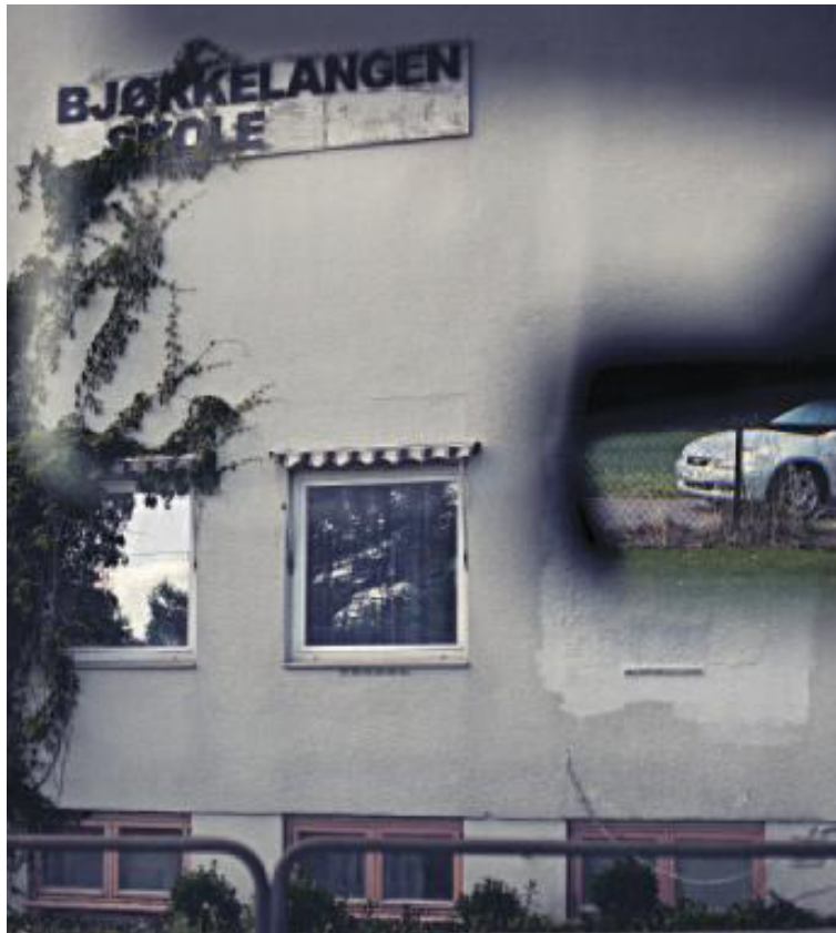
Bjørkelangen ungdomsskole varmes opp kun ved hjelp av bioenergi.

Med andre ord: Nok en sommeruke uten de aller største utsiktene til shortsvær og badeliv. (NTB)