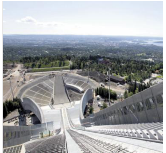
Det var strålende vær og utsikt da heisen til toppen av hoppbakken i Holmenkollen ble offisielt åpnet i går, men værutsiktene for resten av uka er temmelig usikre.