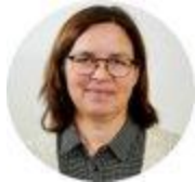
Oppvekststab og pedagogisk tjeneste