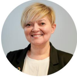
Kommunalsjef Oppvekst og utdanning