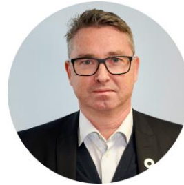
Stabssjef Strategi og utvikling