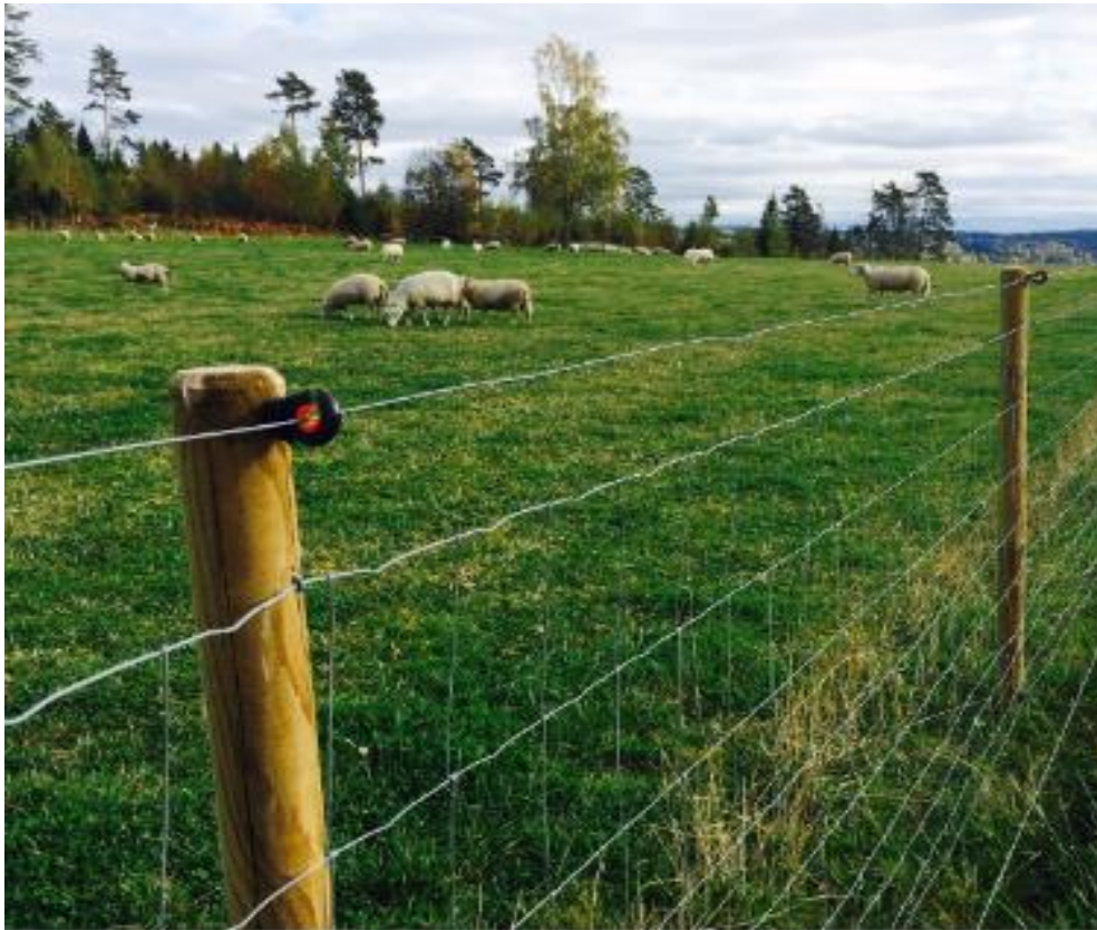
Roviltavvisende gjerde i Enebakk.