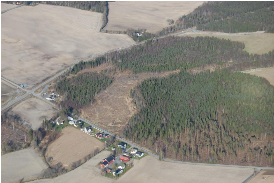
Killingmo næringsområde ved under utvikling

Vedtatt av kommunestyret 8. februar 2016